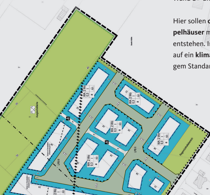
Lageplan des Baugebiets »Lange Wand 3«