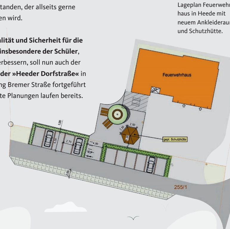
Lageplan Feuerwehrraum in Heede mit neuem Ankleideraum und Schutzhütte.